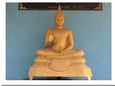
พระศากยมุนีศรีชนแดน

เลขที่ 115/3 หมู่ 13 ถนนชมภูระเวช ตำบลชนแดน อำเภอชนแดน จังหวัดเพชรบูรณ์ 67150