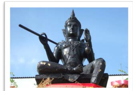
พระวิษณุกรรม สัญลักษณ์แห่งครูช่าง